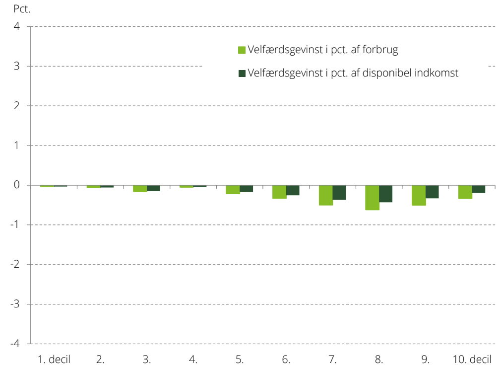
Figur 2. Fordelingseffekter af klimareformen